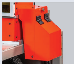
▶ Réceptacle de récupération

TAGMARK LASER est équipé d'un réceptacle de récupération des plaques marquées. Un système de collecte par gravité est proposé en option pour un empilement ordonné.