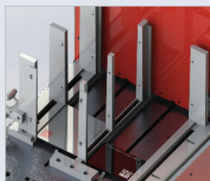
▶ 2 voies de marquage