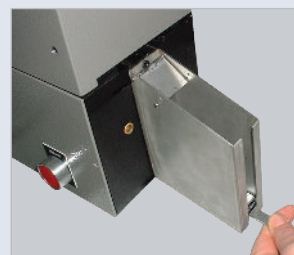
▶ Système de collecte ordonnée